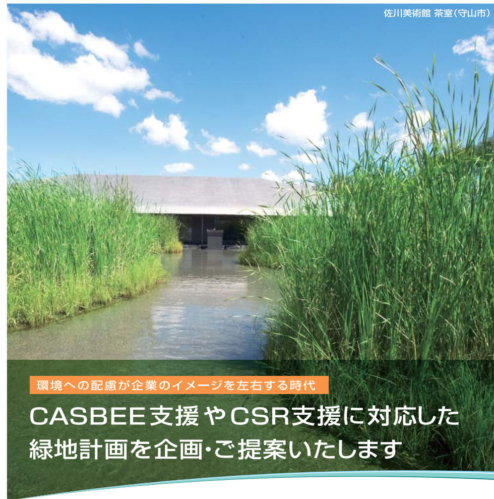
佐川美術館 茶室(守山市)