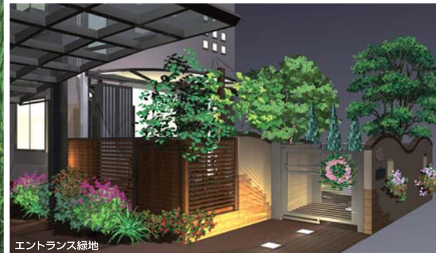
エントランス緑地