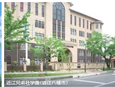
近江兄弟社学園(近江八幡市)