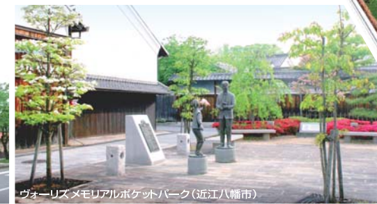
ウエハラメモリアルポケットパーク(近江八幡市)