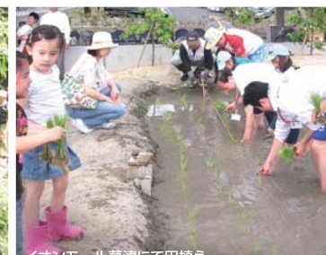
イオンモール草津にて田植え